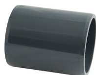
MD50 & MD63